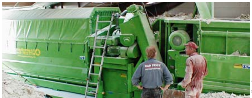
Mit der semimobilen Anlage gewinnt die Arbeitsgemeinschaft in Wiesbaden 90 Prozent Gips, 8 Prozent Papier sowie 2 Prozent Metalle aus Gipskartonplatten

Gemeinsam wollen sie erreichen, dass zumindest ein Teil der jährlich 300.000 Ton-